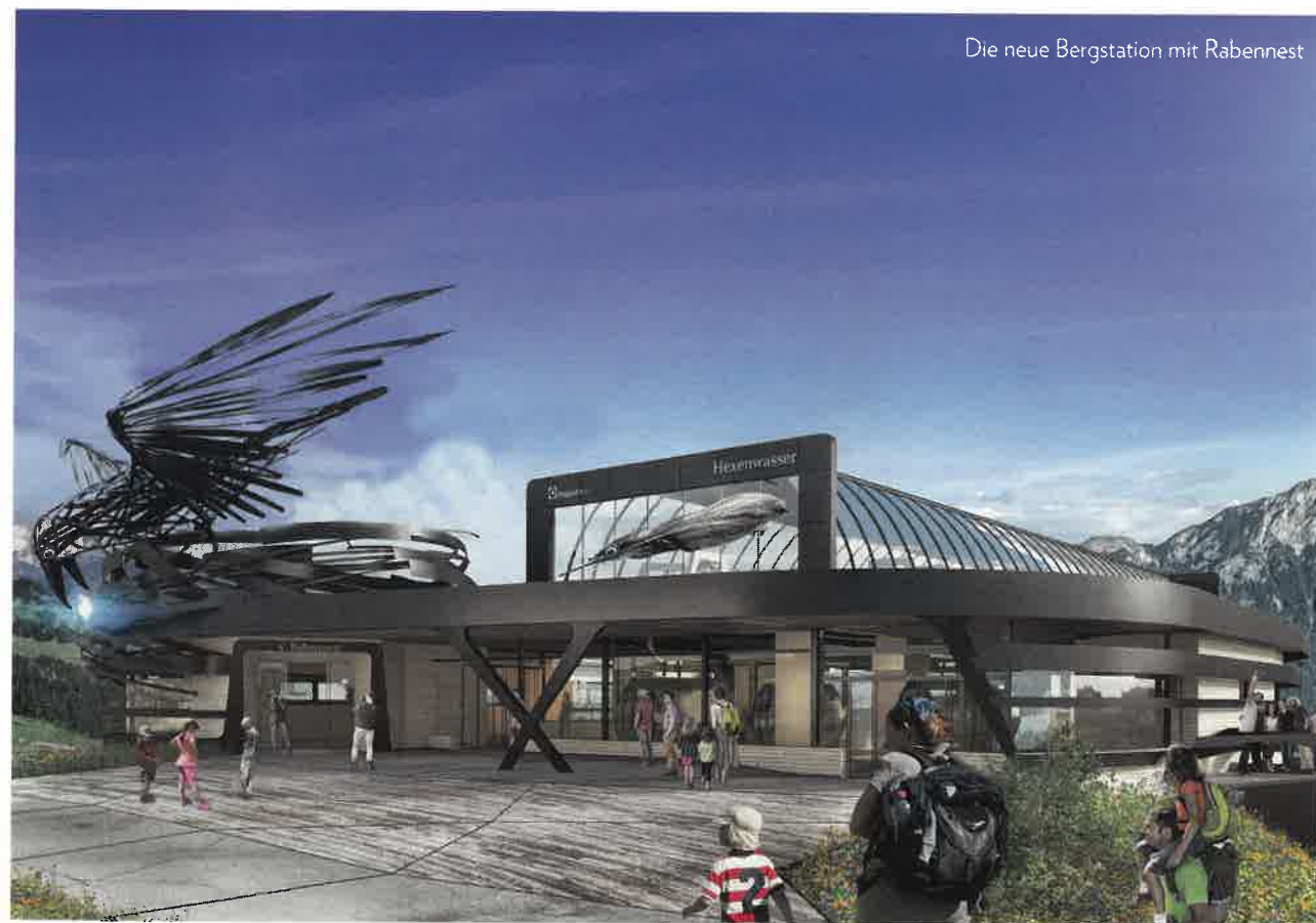
Die neue Bergstation mit Rabennest