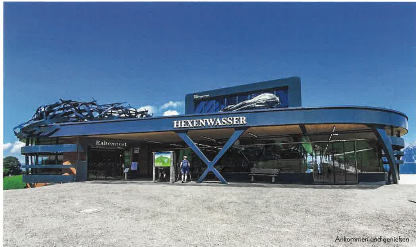
Ankommen und genießen