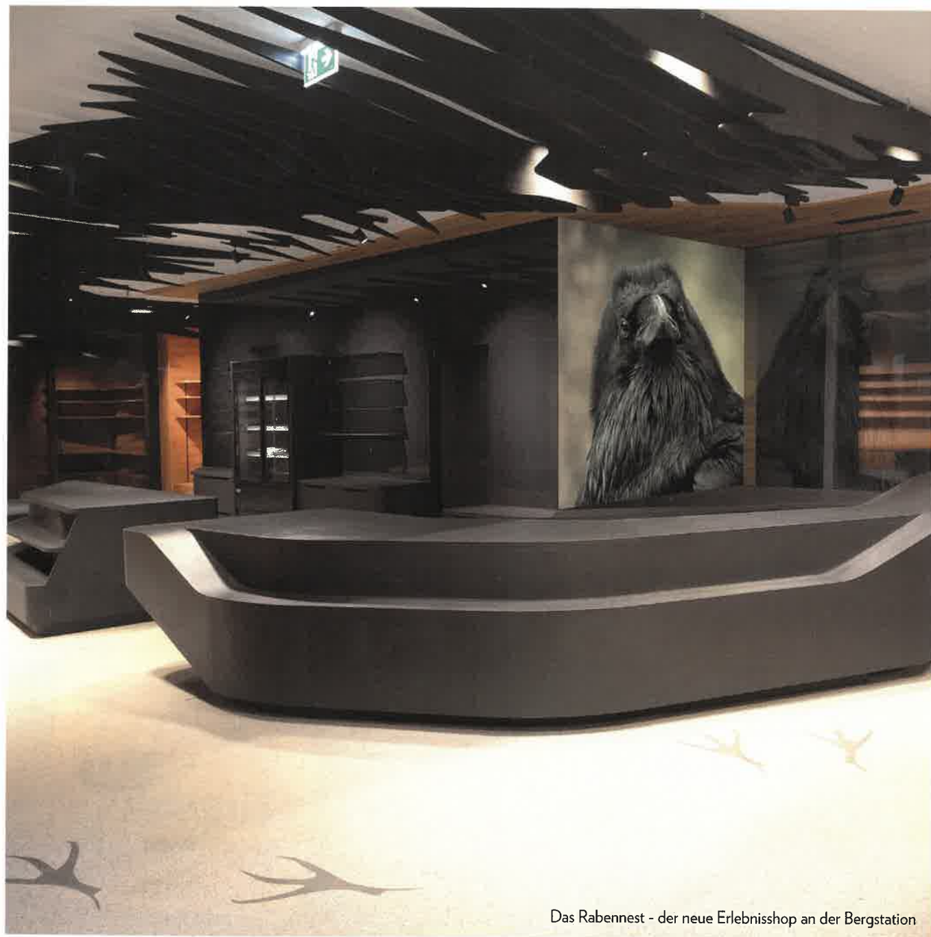
Das Rabennest - der neue Erlebnisshop an der Bergstation

ELEK BERCHTOLD Planung Ausführung Wartung