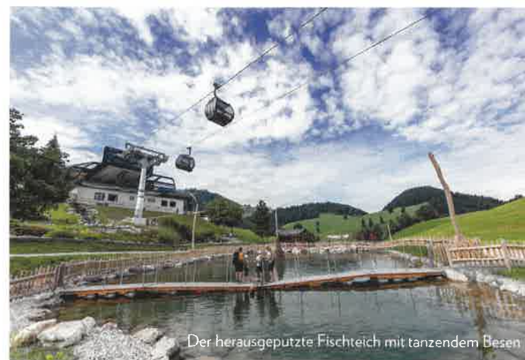
Der herausgeputzte Fischteich mit tanzendem Besen

A-6330 Kufstein, Südtiroler Platz 12 Tel. 0 53 72 / 621 01 E-Mail: kontakt@mayr-vermessung.at www.mayr-vermessung.at www.sturm-vermessung.at