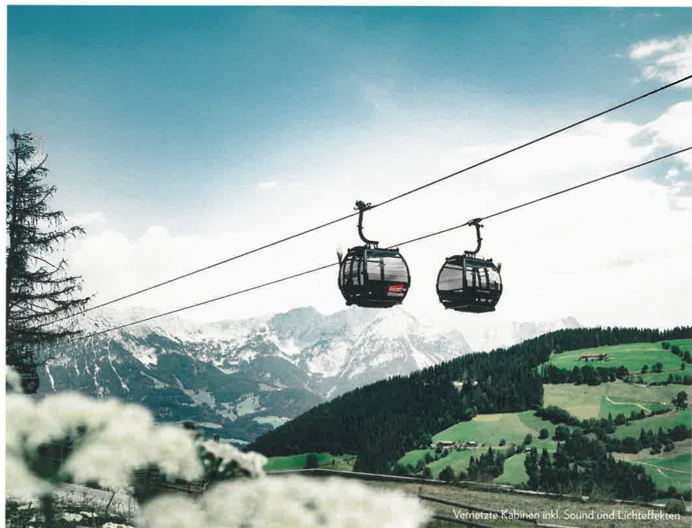
Vernetzte Kabinen inkl. Sound und Lichteffekten